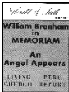
Voorpagina HERALD of FAITH - Februari 1966

CITAAT 67: (Door Rev. Joseph D. Mattsson-Boze, uitgever van 'Herald of Faith Magazine'.) (Vertaald)