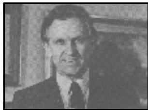
Rev. T.L. Osborn

“...Dit is een afsluitende generatie. Er moest iets gaan gebeuren. Het kon niet gaan zoals vorige generaties voorbij gingen. Zij moeten opnieuw weten wie God is. En Hij kwam naar beneden en zond een kleine man, een profeet... ...ledere keer dat dit teken aan zijn hand verscheen, stond hij daar en vertelde waar ziekte vandaan kwam. Dat schokte mij, want ik had er nooit over nagedacht waar ziekte eigenlijk vandaan kwam. Het is er toch gewoon?