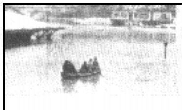
OHIO OVERSTROMING 1937

Ik kon de motor niet gestart krijgen, en ik hief mijn handen op, en ik zei: "Oh, God, laat mij niet verdrinken. Ik ben het niet waard om te leven, maar denk aan mijn vrouw en baby."