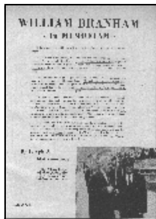
Herald of Faith -Febr-1966; p.3 - W. Branham

(Uit: William Branham - In MEMORIAM - 'Herald of Faith'. Febr.1966 - Pag. 3 )