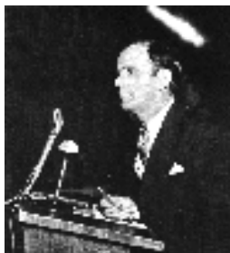
De Engel openbaart Zich in een Vuurkolom - Houston Texas. USA - 24 jan. 1950

UNCHANGABLE.GOD.title TULSA.OK 60-0326 (Vertaald)