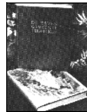
Een uiteenzetting over de 7 Gemeentetijdperken uit Openbaring 1 - 3

(Uit: 'Het Gemeente-tijdperk van Laodicea', JEFF.IN ROJC 43 60-1211E.)