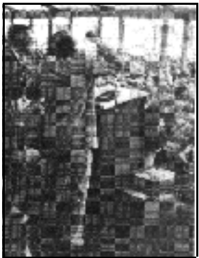
1955 Duitsland. - Predikend in de tentcampagne in Karlsruhe.

Hij bidt het de apostelen na: "Strek Uw hand uit tot genezing! Uw naam is nog Jezus! Uw arm is niet verkort!"